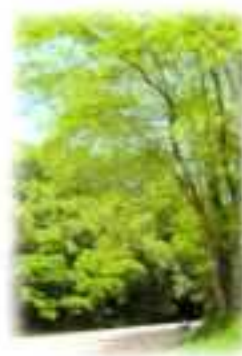
4号地 飯能河原 周辺河岸緑地