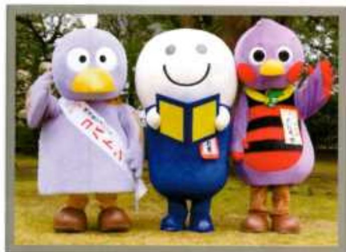
ブックオフ公式キャラクター「よむよむ君」とのコラボレーション