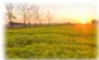
10号地 浮野の里 (ノウルシ)