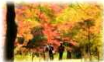
3号地 武蔵嵐山溪谷周辺樹林地