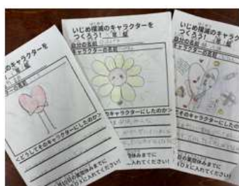
いじめ撲滅キャラクターの募集

いじめ撲滅キャラクターを全校で募集し、学校で決めたいじめ撲滅スローガンをもとに、代表委員が決定した。